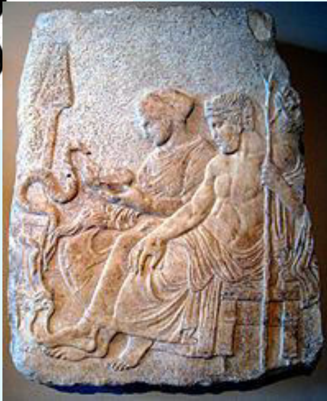
Asclepius with his daughter Hygieia